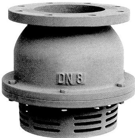
Aço Carbono (V. Inox)